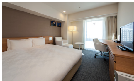
モデレートダブル (26m²)