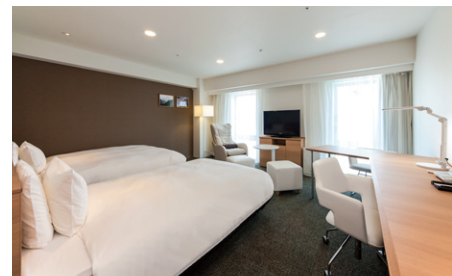
スーペリアツイン (38m²)