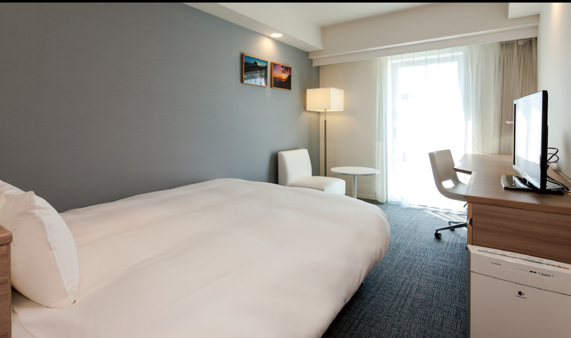
スタンダードシングル (20m²)