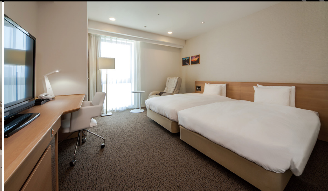
ハリウッドツイン (30m²)