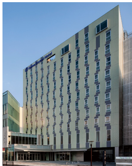
ダイワロイネットホテルぬまづ

富士を背に、駿河湾に臨む古来からの港町沼津—。 JR沼津駅北口から徒歩で約3分という至便の立地、 大型コンベンション施設プラサヴェルデの一角に建ち、 各種イベントへのアクセスもスムーズ。 「ダイワロイネットホテルぬまづ」を、 沼津でのビジネス・観光の拠点としてぜひご利用ください。