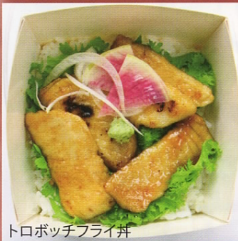
トロボッチフライ丼