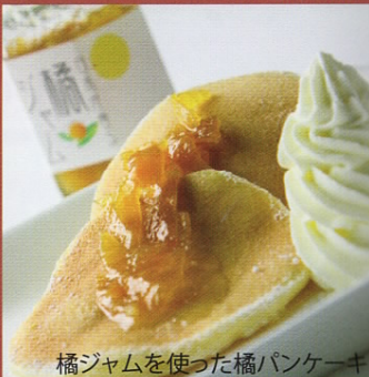
橘ジャムを使った橘パンケーキ