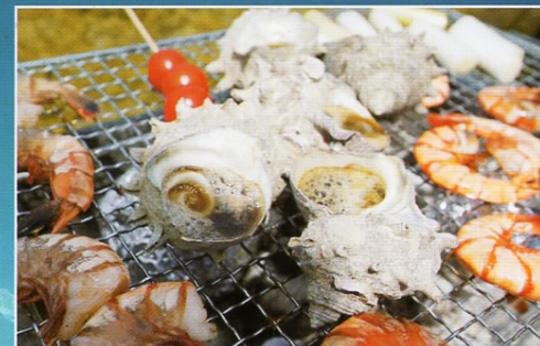
バーベキューで仲間との楽しいひとときを