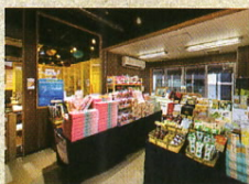
土産処 港八十三番地横丁

【入館料】大人(高校生以上)1,600円、こども(小・中学生)800円 幼児(4才以上)400円、65才以上の方は大人料金より100円引き 【営業時間】10:00~18:00 【電話】055-954-0606