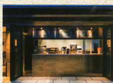
Cafe Latimeria ラティメリア