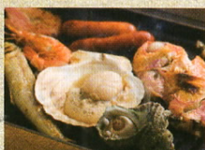
浜焼きしんちゃん