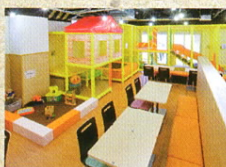
親子カフェ Nautilus ノーチラス