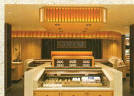
佐政水産 アントレ沼津店