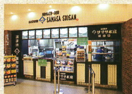
駿河湾沼津SAフードコート 海鮮食堂サマサ水産