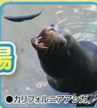
●カリフォルニアアシカ