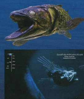
※「深海の世界」で上映中のCG映像

深海には、古代から姿を変えずに生き続けている【生きた化石】と呼ばれる生物が数多く生息しています。なかでも日本一深い湾の駿河湾には世界最大のタカアシガニや、ラブカ、ミツクリザメなど、多くの深海性の【生きた化石】が息づいています。また3億5千万年前から姿を変えずに生き続けているシーラカンスも水深700m付近の深さにまで生息している深海性の魚類なのです。地上で環境が大きく変化している間も、深海はほとんど環境が変わることがありませんでした。その結果、深海で暮らす古代生物が現代にまで多く生き延びることができたのではないかと考えられています。