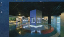
ミュージアムショップ ブルージェリー