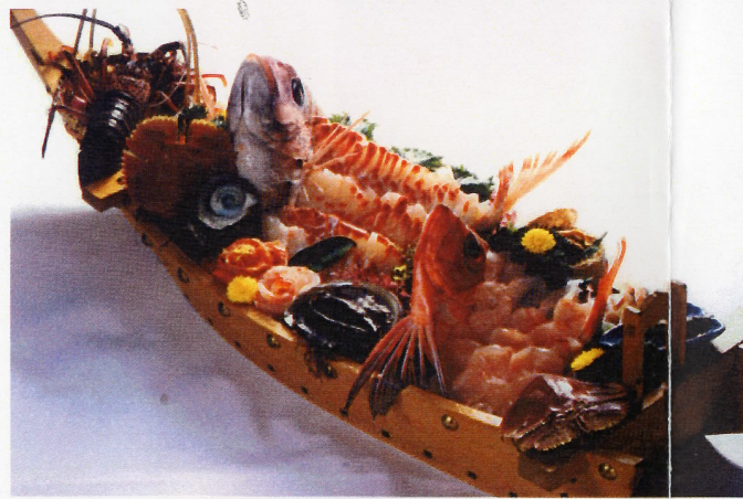
美浜のおすすめ 舟盛り