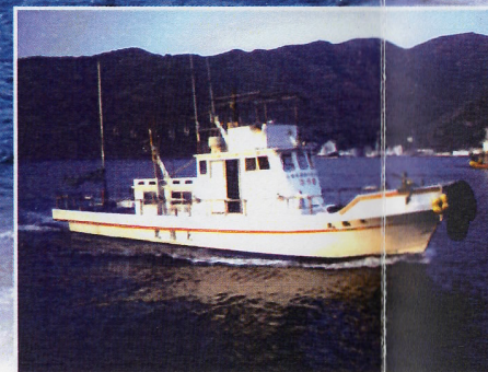
釣舟「太陽丸」 年間を通して釣りが楽しめます