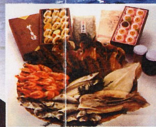
西伊豆のおみやげ