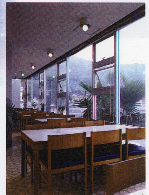
ガラス張りのレストランで、海・夕日を見ながらお食事を