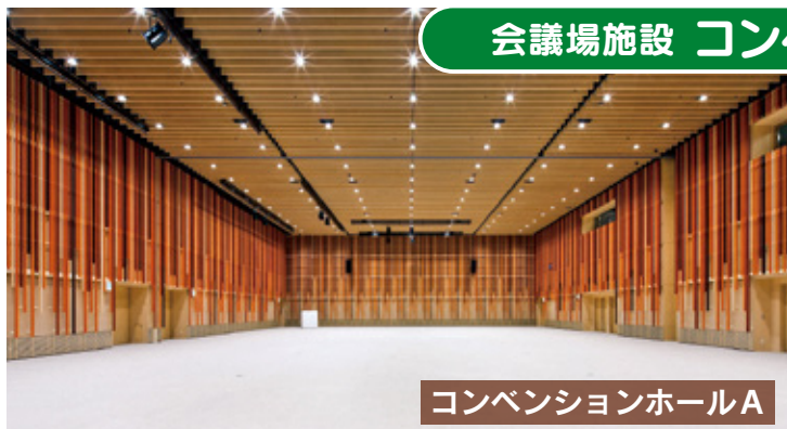
コンベンションホールA

様々な用途に応じて自由なレイアウトが可能な、静岡県内最大級の大型コンベンションホール