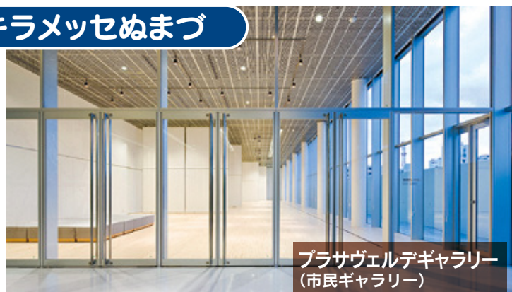
プラサヴェルデギャラリー (市民ギャラリー)

面積3,875m 2 、天井高12.6mの多目的ホールは、1/3分割、2/3分割のご利用も可能です。各種展示会やイベントなど様々な催事に対応しています。コンクリート敷きの床には、電気、上下水道配管用ビットも完備しています。