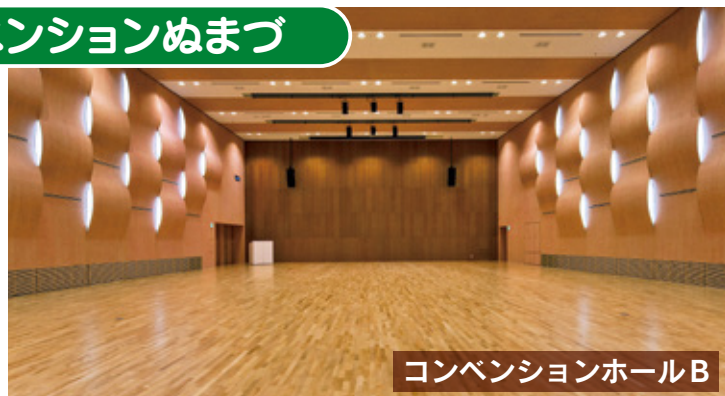
コンベンションホールB

コンベンションホールAは、レイアウトが自由な平土間の会議室としては県内最大級で、シアター形式で1,000名、スクール形式で690名収容可能です。用途に応じて2分割のご利用もできます。学会、講演会など、大規模なコンベンションに対応しており、同時通訳ブースの設置も可能です。