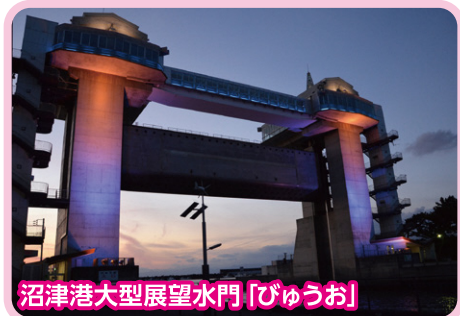
沼津港大型展望水門「びゅうお」