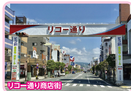
リコー通り商店街