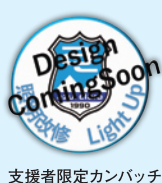
支援者限定カンパッチ