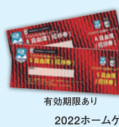
有効期限あり 2022ホームゲームベア招待券