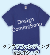
クラウドファンディング記念Tシャツ

すべての発信地となるホームゲームに少しでも多くの方にお越しいただきたく、直接お手渡しするコースもあります。リターンは基本の右記の3点セットをベースに金額に応じ希少なものといたします。