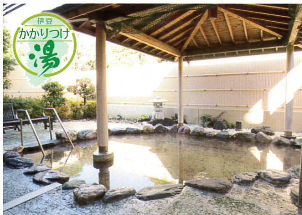
天然温泉露天風呂