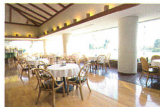
喫茶 ラウンジ・グリーン 1F