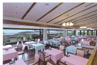
レストラン サンシャイン 2F

神経痛、筋肉痛、関節痛、五十肩・運動麻痺、関節のこわばり、うちみ、くじき、慢性消化器病、痔疾、冷え性、病後回復期、疲労回復、健康増進 他