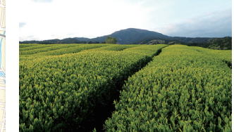
盛產茶的愛鷹山麓地區 お茶の生産が盛んな愛鷹山麓地域

戶田聞名遐邇的特產是在日本最深處的駿河灣撈捕的高腳蟹。在戶田可以享用新鮮的高腳蟹，巨大的身軀口感清爽鮮美，可感受到螃蟹獨特又富有層次的風味。