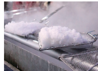
戶田鹽 D1 戶田塩 「戶田鹽」是將駿河灣汲取的海水經過約13小時的大鍋燒煮，全程採取手工作業製作出的鹽。可體驗這種傳統製鹽工法的部分製程。品嘗看看現製的鹽吧! 預約/洽詢：NPO戶田鹽之會 0558-94-5138 ※僅能以日語對話

預約制計程車 「戶田-江梨之間 需求反應式共乘計程車「FUJIMI go!」」 預約制タクシー (戶田-江梨間 デマンド式乗合タクシー「ふじみgo!」) 前往大瀨/戶田地區者，請利用預約制的定時行駛共乘計程車。請指定上下車區段，並於搭乘班次2小時前以電話預約。 ※上午9點以前出發的班次，最遲須於前一天的17:00前預約 戶田交通 預約電話：0558-94-3456 (僅能以日語對應)