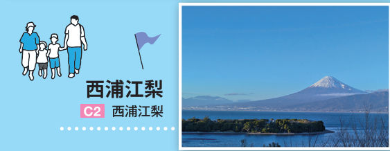
西浦江梨 C2 西浦江梨