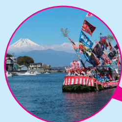
大瀨祭 (4月) C2 大瀨祭り (4月)