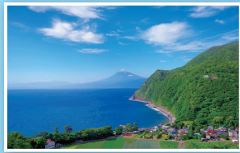
輝煌之丘 D2 煌めきの丘