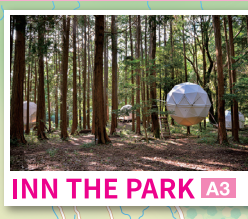
INN THE PARK A3 駿河灣沼津服務區 (SA) 駿河灣沼津Smart IC

推薦的伴手禮! 沼津茶 靜岡是知名的茶產地，佔日本約4成的茶產量。沼津茶的特色在於其芳醇的香氣。