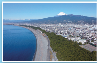
千本濱公園 千本浜公園 A1 B3